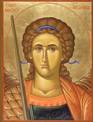
Illustrations : Marie-Madeleine au tombeau 2007 / St Michel 2001 - Sr Mateusza